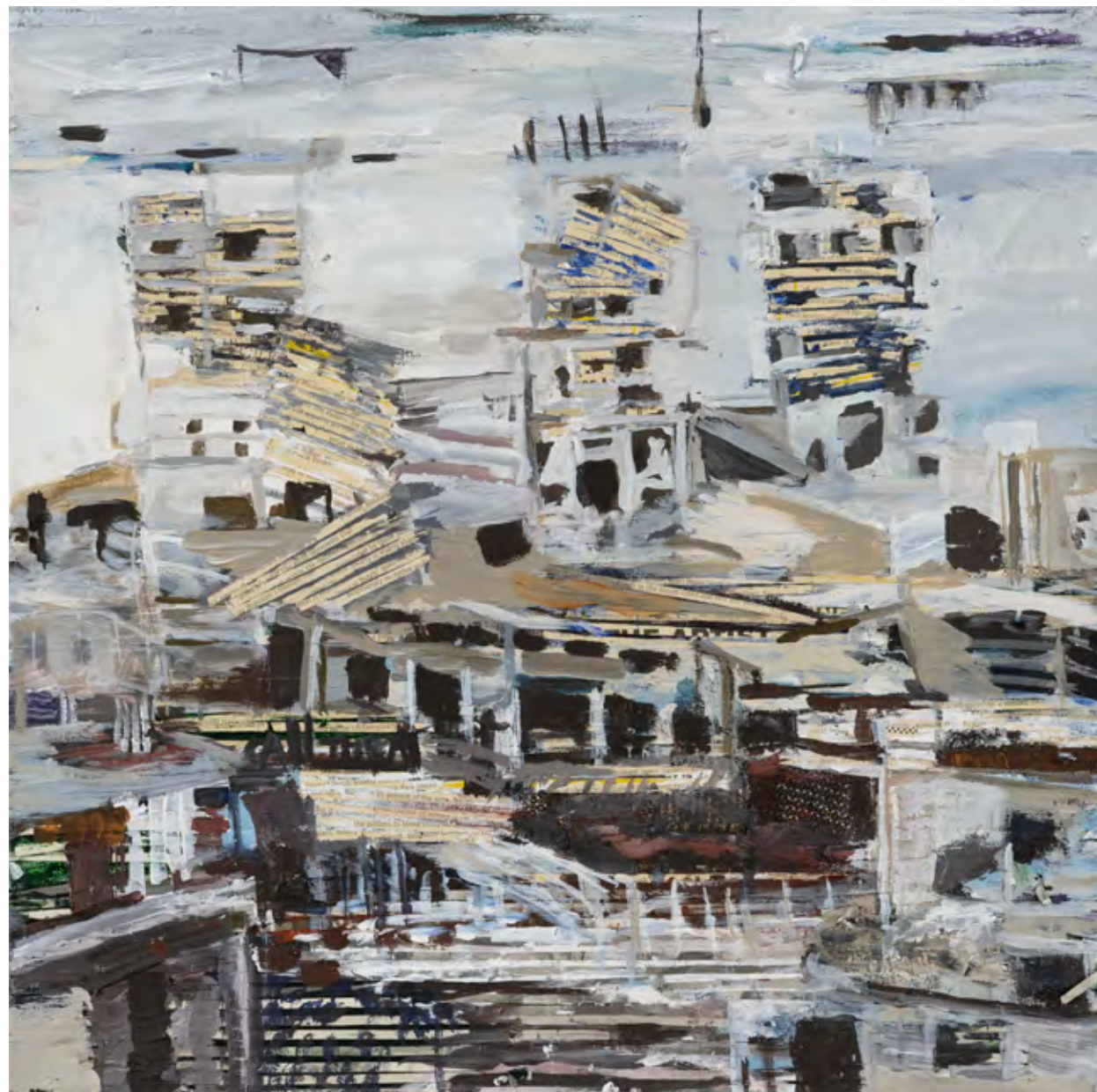
call the artist gesneden tekst en textiel, acryl en inkt op doek, 50 x 50 cm, 2016