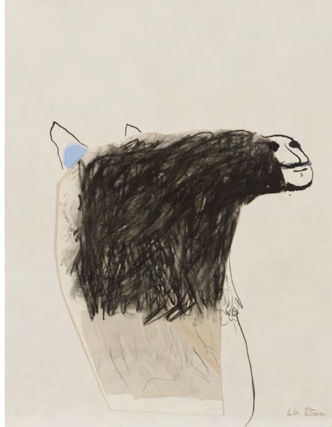
state of mind inkt, krijt, collage op papier, 46 x 37 cm, 2000

De hele cultuur is hier vergeven van de gezelligheid, opgefokte vrolijkheid. Waar kan het verdriet, de woede en de wanhoop naar toe?