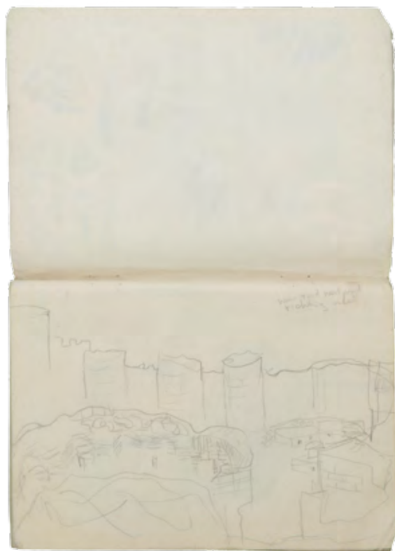
schetsboek Dyarbakir 1991