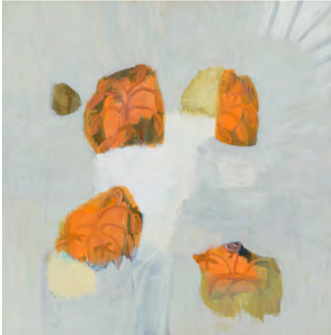
boeket acryl op doek, 130 x 130 cm, 2005